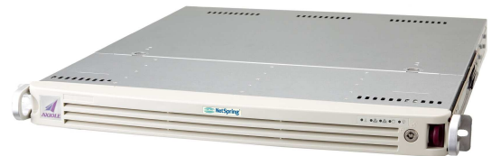
認証アプライアンスサーバ「AXIOLE」

AXIOLE は、ネットワーク認証に特化した認証サーバ製品で、導入・運用管理の容易性と外部連携の柔軟性に優れているのが特長。認証サーバに必要なスキーマをあらかじめ構築しているため、ディレクトリ設計など煩雑な作業を必要とせず手軽に導入可能です。ネットワーク認証に必要な機能だけを取りそろえ、使いやすくアプライアンス化しているため、統合認証システムの構築・運用・保守において余計なコストが発生せず、TCO の削減に寄与します。AXIOLE は、LDAP/RADIUS 認証をサポートしており、ネットワーク上のさまざまな機器やサービスからの認証要求に応えることが可能。さらに複数の LDAP サーバや Active Directory との連携ができるため、AXIOLE に仮想的に ID 管理を集約することができます。