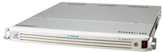
認証アプライアンスサーバ「AXIOLE」

AXIOLE は、ネットワーク認証に特化した製品で、導入・運用管理の容易性と外部連携の柔軟性に優れているのが特徴。認証サーバに必要なスキーマをあらかじめ構築しているため、ディレクトリ設計など煩雑な作業を必要とせず手軽に導入可能です。ネットワーク認証に必要な機能だけを取りそろえ、使いやすくアプライアンス化しているため、統合認証システムの構築・運用・保守において余計なコストが発生せず、TCO の削減に寄与します。AXIOLE は、LDAP/RADIUS 認証をサポートしており、ネットワーク上のさまざまな機器やサービスからの認証要求に応えることが可能。さらに複数の LDAP サーバや Active Directory との連携ができるため、AXIOLE に仮想的に ID 管理を集約することができます。