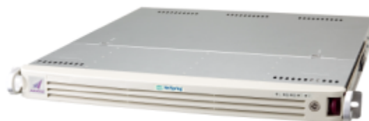
認証サービスプラットフォーム「AXIOLE」

AXIOLE は、各種認証サービスの基幹サーバーとして動作する“認証サービスプラットフォーム”で、ネットワーク認証に特化した製品です。導入・運用管理の容易性と外部連携の柔軟性に優れており、各社 SOA 製品と組み合わせ使用した際に、SOA の厳密性を高め、高度なセキュリティを実現します。