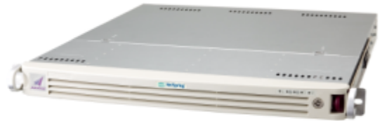
認証サービスプラットフォーム「AXIOLE」

AXIOLE は、各種認証サービスの基幹サーバーとして動作する“認証サービスプラットフォーム”で、ネットワーク認証に特化した製品です。導入・運用管理の容易性と外部連携の柔軟性に優れており、各社 SOA 製品と組み合わせ使用した際に、SOA の厳密性を高め、高度なセキュリティを実現します。